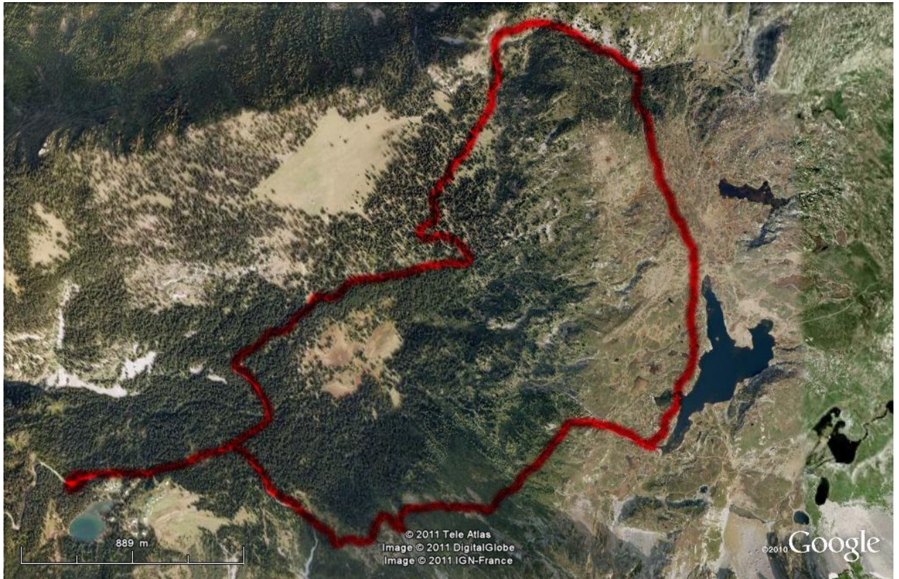
Samedi 26 juin : circuit depuis le lac de Poucellet vers le lac Fourchu sous le Taillefer