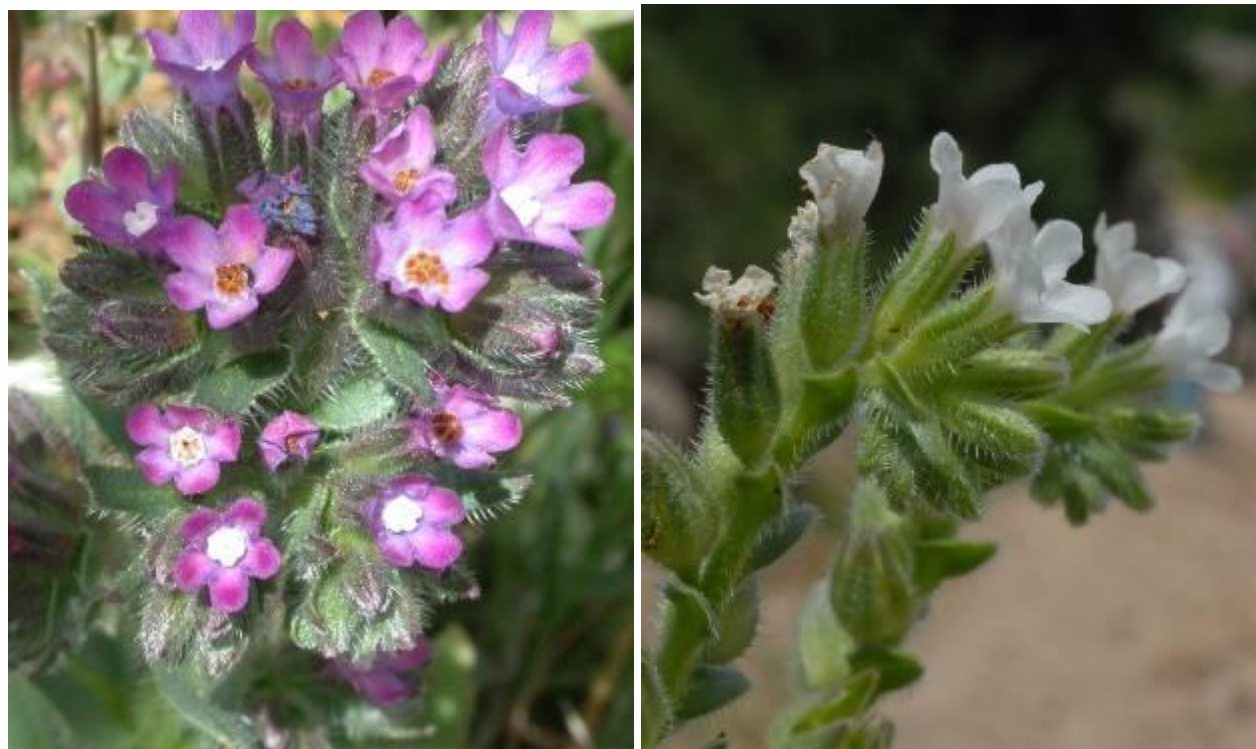
Anchusa atlantica Ball. = Anchusa undulata subsp. atlantica (Ball.) Braun-Blanq. & Maire