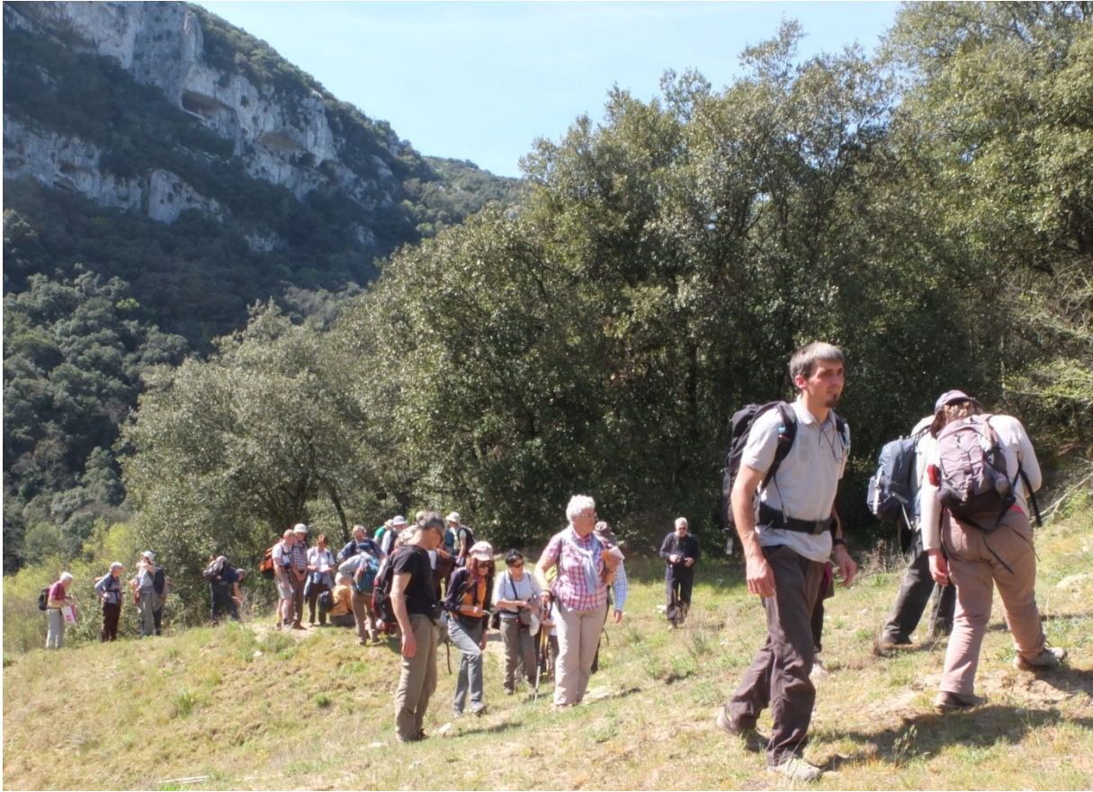
Vers la dune de sable