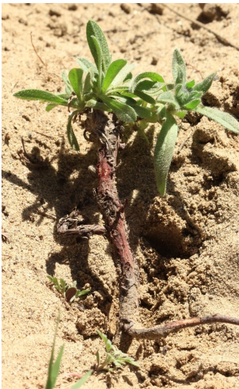
Racine de l' Alkanna matthioli