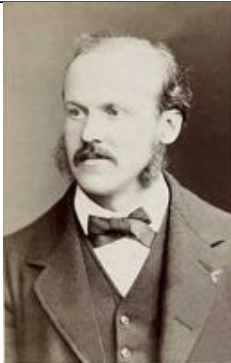
Alphonse Milne-Edwards par Truchelut et Valkman BNF Gallica.jpg

Né le 13 octobre 1835 à Paris. Décédé le 21 avril 1900 à Paris.