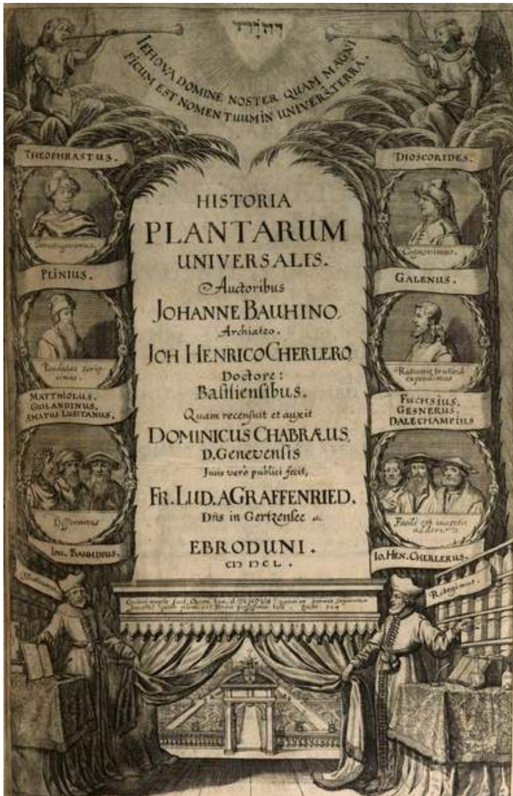
Frontispice du premier tome de l' Historia Plantarum Universalis , 1650