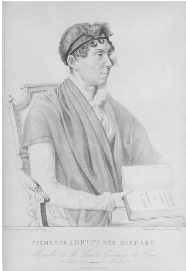
Portrait Ann. Soc. lin. Lyon , 1836.

Décédé le 15 avril 1835 à Oullins, Rhône.