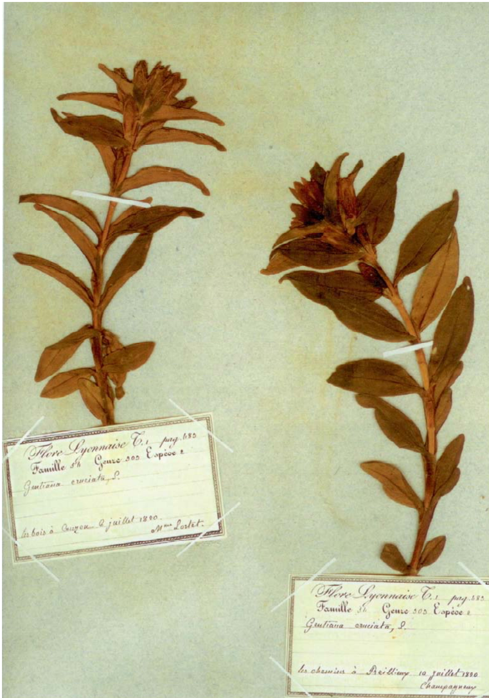
Herbier de la Flore Lyonnaise. Gentiana cruciata L.

Herbier des plantes du Mont Cenis. 226 espèces récoltées pendant l'exploration d'août 1826. L'herbier primitif du Séminaire de l'Argentière (Rhône), qui d'après son organisateur, l'abbé Chirat "est en grande partie l'ouvrage de Cl. Lortet".