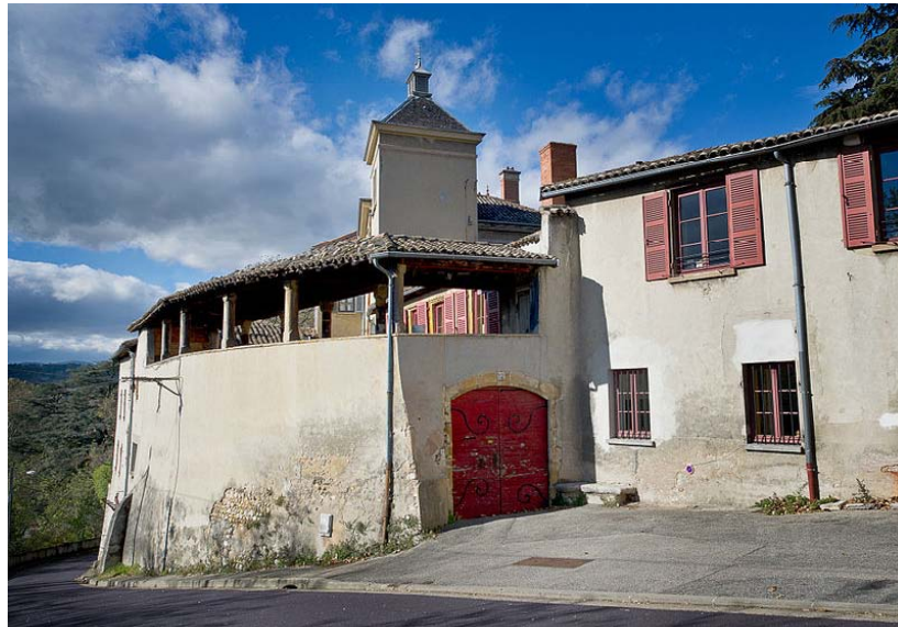
Maison de la Cadière, actuellement. Maison des champs du XVIe, la galerie renaissance de cette imposante demeure est inscrite à l'inventaire supplémentaire des monuments historiques depuis 1972. 12 chemin de la Cadière, 69600 Oullins – France.

utiles de la maison Pilata (1785–1798), Société d'amateurs, fondée vers 1785 « pour l'étude en commun de la physique, ... botanique » qui se réunissait tous les jeudis, dans la maison Pilata (Magnin 1906), p. 4