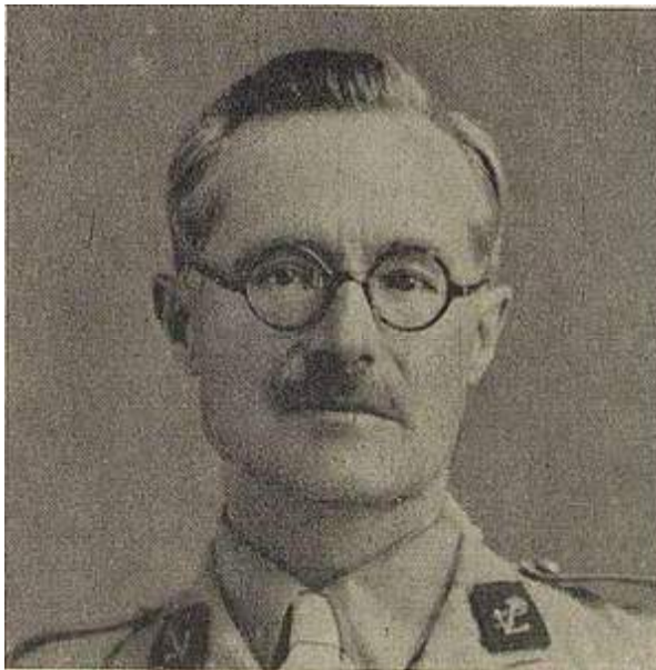
Anonyme 1947. Decary Raymond. Rép. des Intell. , 3. Notice 59. Portrait. Archives nationales. Base Léonore. N°26.

Né le 22 novembre 1891 à Méry-sur-Seine, Aube. Décédé le 14 décembre 1973 à Paris.