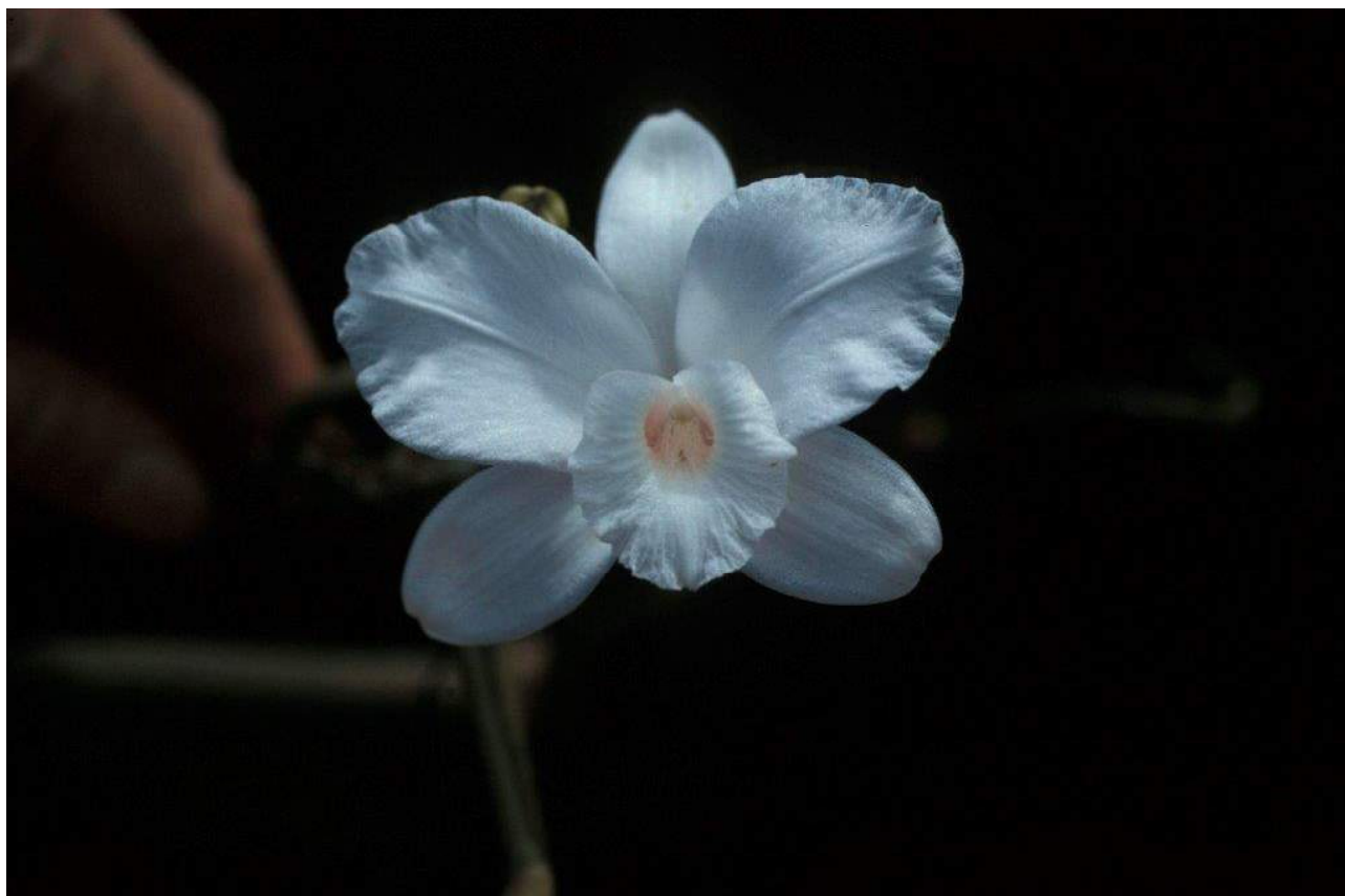
Vanilla decaryana .

Vanilla decaryana H. Perrier. Orchidaceae