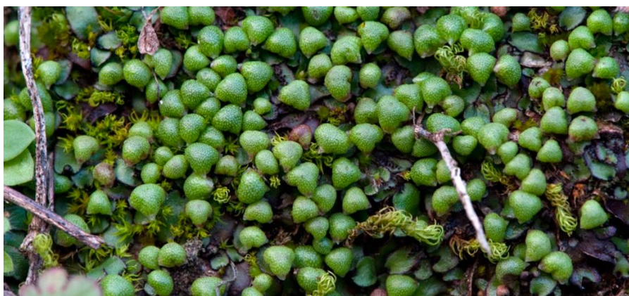
Figure 1 : la Mannie androgyne, une hépatique rhodanienne d'affinité méditerranéenne