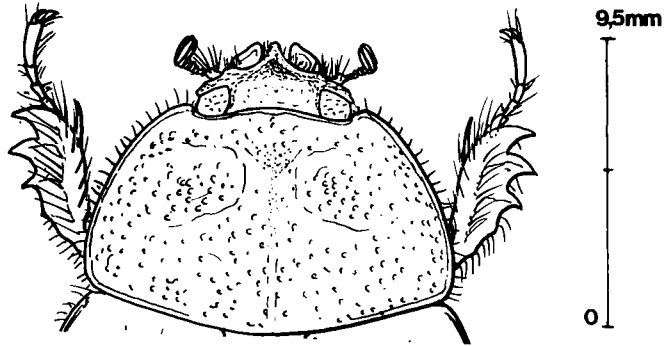
Figure 1 : Tête et pronotum d' Endroedianibe bozzolai Chalumeau.

I.R.E.C., B.P. 119, 97152 Pointe-à-Pitre (Guadeloupe).